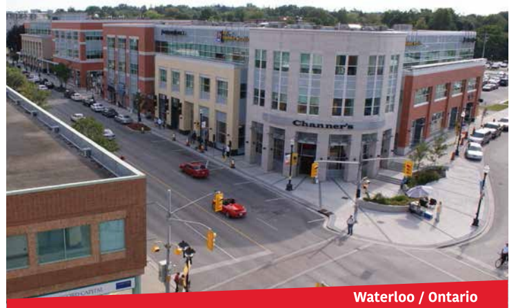
Waterloo / Ontario